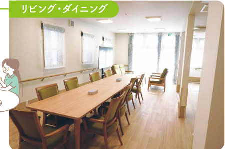
リビング・ダイニング