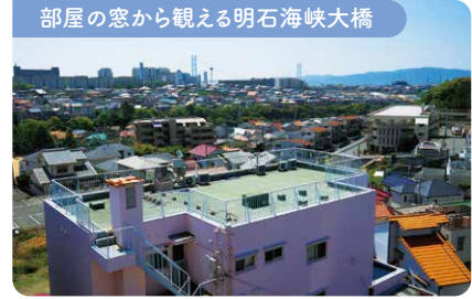
部屋の窓から観える明石海峡大橋